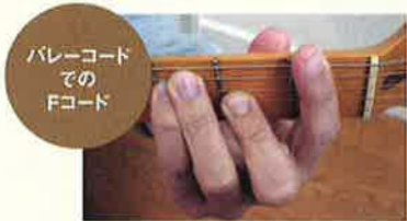
バレーコード での Fコード

もし、まだFコードがうまく弾けない。と壁にあたっている方は、一度、このシェイクハンド型の押さえ方を試していただいてはどうでしょうか。