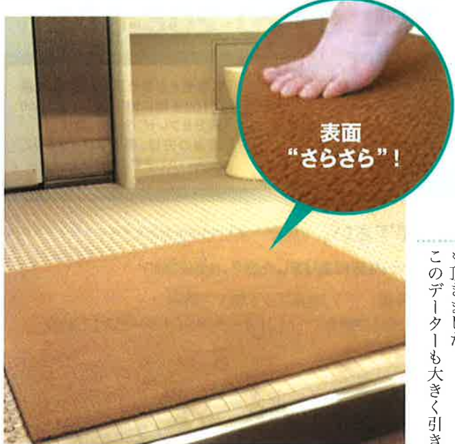
■ヒルトン大阪内フィットネスクラブ

そんな時、タイミングよくダイキチさんから、この「素足さらさらマット」の案内を頂きました。さっそく、フィットネスの男女浴場の出入り口に試しに置いてみました。そこは、今までサウナで使用していたバスケットを敷いていて、濡れるたびに1日に何十回も交換をしているところでした。メンバー様に具合を聞くと、「歩くとさらさらしていて、今までのバスケットの濡れた感じはないし感触も非常にいいね」というお声を頂きました。また、白癬菌(水虫菌)の繁殖を防ぎ、お客様にうつらない、安心して使用できるデータも頂きました。このデータも大きく引き伸ばして、プリントし、お客様に見てもらえるところに張り出したところ、お客様からこの「琥珀の爽」というお声があり、すぐに導入を決めました。