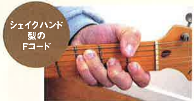
シェイクハンド 型の Fコード